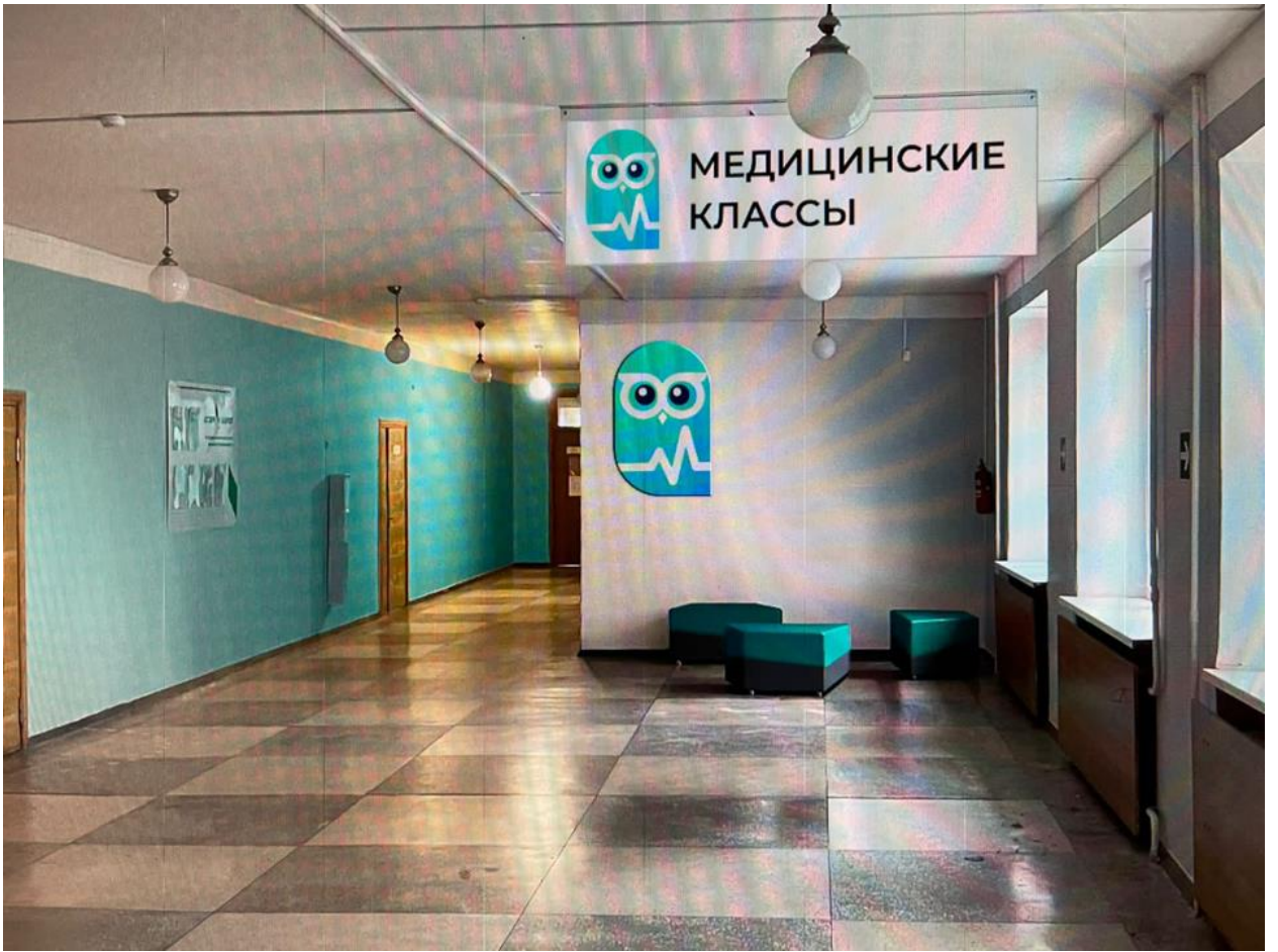
Рис. 10 Дизайн-проект холл медицинского класса согласно фирменному стилю